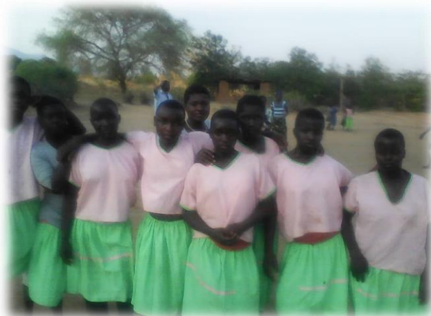
De Linga en de Chilulu school netbalploeg

Gekleed zoals in lang vervlogen tijden! Het is tijd om hen in een nieuw 'sportkleedje' te steken