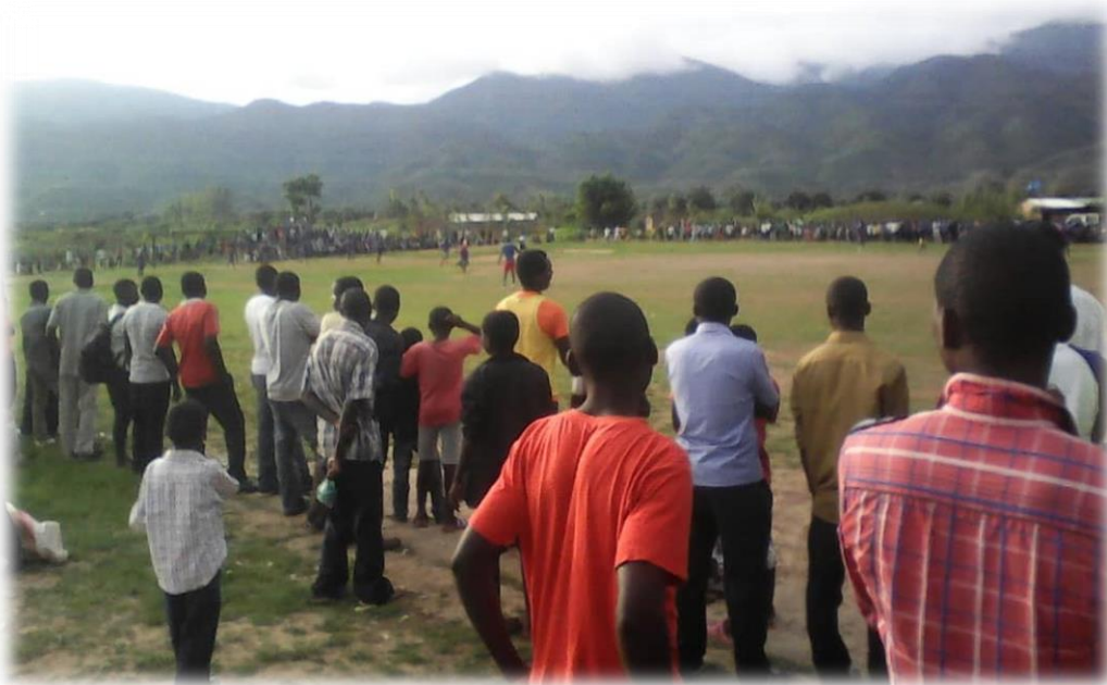
Enthousiaste toeschouwers bij elke voetbalmatch

Dat voetbal populair is in Malawi blijkt uit de foto ons bezorgd door UMOZA coördinator Limbani Chatonda Mhango